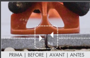
PRIMA | BEFORE | AVANT | ANTES