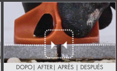
DOPO | AFTER | APRÈS | DESPUÉS